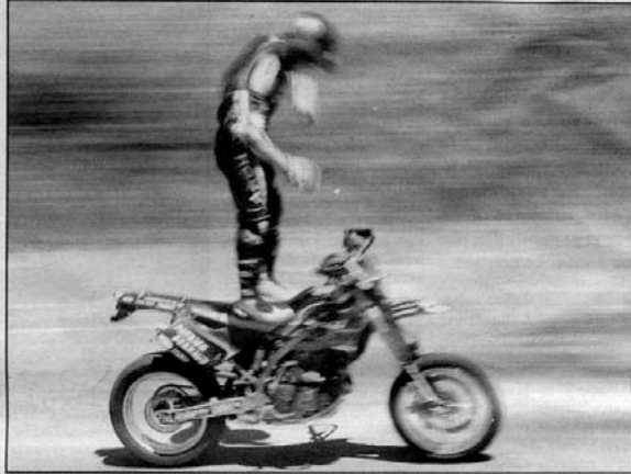
La journée a été rythmée par diverses démonstrations.

Le spectacle terminé, Jonathan de commenter : « C'est un sport comme un autre. » Descendu de sa moto, il prend place sur le podium et annonce aux amoureux de la discipline une bonne nouvelle : « Nous allons tout faire pour qu'une piste de stunt soit mise en place d'ici 2005. Le projet a