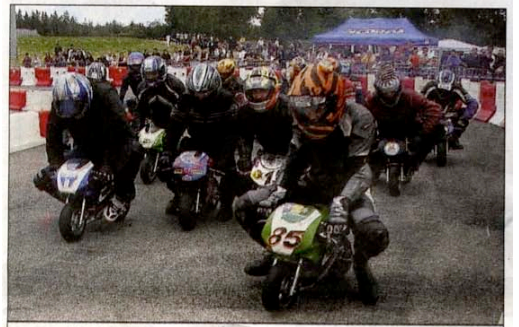
Certains ont testé les pocket-bikes.

nau-le-Lez), du trial club de Fabrègues... Autres champions, les gamins : près d'une centaine d'entre eux a appris à piloter sur une piste Code de la route. Et pas mal de passagères de motards, qui se sont essayées à la conduite de gros cubes. Au total, une fête éducative et spectaculaire. ●