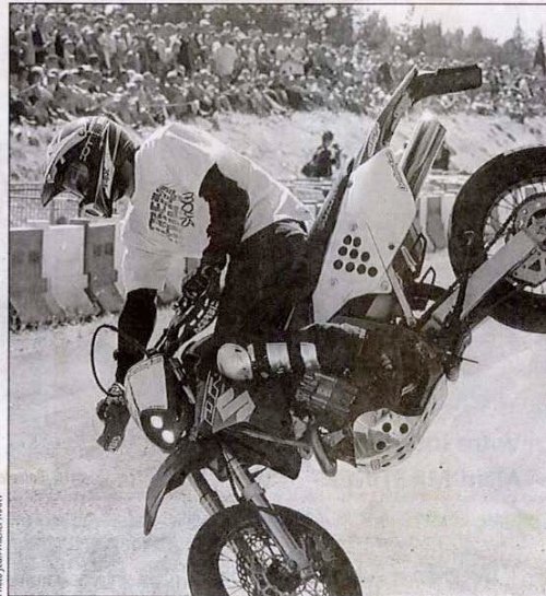
Les séquences de "stunt", l'un des moments attendus par le public.